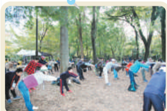
みんなで準備運動