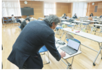
アプリを使って抽選

※世帯全員分について、「医療費分」と「柔道整復師分」を一括して組合員宛てに郵送します。