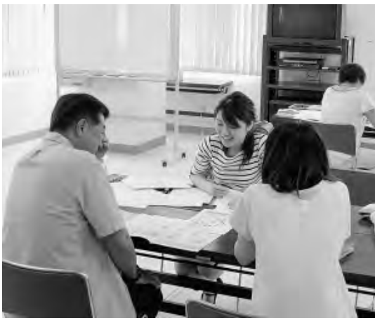
保健指導のようす (練馬支部)