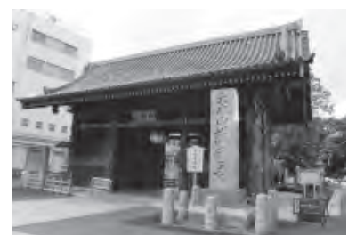
徳川綱吉が建立した護国寺

今回は、目白・雑司が谷・護国寺周辺をめくります。目白駅がスタート地点です。改札口を出て目白通りを右に一つ目の道を右折して道なりに下って行くと、右手に「切手の博物館」が見えてきます。日本や外国の切手が約35万種類、国内でも珍しい郵便切手の博物館です(入館料大人200円)。博物館を過ぎ学習院下を左折して道なりに学習院大学の外周を歩きます。明治通りを渡り都電の踏切を過ぎ一つ目の道を左折します。都内で最も急と言われている坂のひとつ「のぞき坂」が前方に見えてきます。急坂ですがチャレンジしてみたいかがでしょうか。坂を登り切り目白通りを目白駅方面に陸橋を渡り切って都電荒川線沿いに坂を下りて行き、都電鬼子母神前駅手前の道を左折すると鬼子母神堂があります。鬼子母神堂から突き当たりを右折すると左手に大鳥神社があります。都電の踏切を渡り左折して一つ目の道を右折し、道なりに行くと左手が雑司が谷霊園です。ここには夏目漱石・竹久夢二などのお墓があります。霊園を左手にまっすぐ高速道路下の道を渡り、右側を道なりに歩いて行くと左手に護国寺があります。護国寺は徳川綱吉が母の願いを受けて建立したものです。護国寺を出ると、すぐゴールの護国寺駅です。