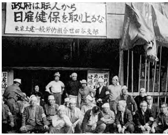
1964年、日雇健保廃止反対集会に集結した仲間たち