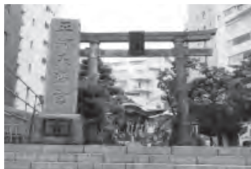
菅原道真が祀られている平河天満宮

今回はかつての大名屋敷街である紀尾井町周辺を歩きます。この周辺は坂が多くアップダウンが激しいエリアです。半蔵門駅4番出口から地上に出て右手に進みます。日本カメラ博物館の看板が見えたら右折します。博物館前をそのまま進み、突き当たりを左折すると千鳥ヶ淵の交差点がありますので、右折して内堀通り沿いに歩くとイギリス大使館が見えてきます。英国王室の紋章が施された格調高い建物です。そのまま半蔵門交差点(新宿通り)を渡り、二本目の路地を右折します。信号を渡り、その次の路地を左に進むと、平河天満宮に到着します。この辺りの地名(平河町)の由来となっており、ビルやマンションの間にひっそりと立っています。天神様(菅原道真)のシンボルの牛の石像が鎮座しています。神社を出て正面の坂を下り、突き当たりを右手に歩きます。突き当たりの貝坂通りを下り、左手に砂防会館が見えたら右折。突き当たりの諏訪坂を下ると地下鉄永田町駅の表示が見えてきます。右手すぐには赤坂見附の交差点が見えます。弁慶橋を渡って紀尾井町通りを歩くと10分ほどで清水谷公園に到着。この公園は、江戸時代には紀尾井町の由来である紀伊徳川家と井伊家の屋敷があった場所で、清水が湧き出たことから、その名がついたと言われていました。園内には、この付近で暗殺された大久保利通の石碑があります。公園を出て紀尾井町通りを進行方向に進み、信号を渡ってまっすぐ歩くと10分ほどでゴールの四ツ谷駅です。