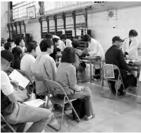
江戸川支部 集団健診のようす