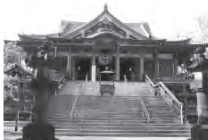
目黒不動としても親しまれる瀧泉寺

今回は不動前駅から戸越銀座駅まで歩いてみましょう。東急目黒線不動前駅改札を出て左に道なりに進むと信号に突き当たります。春は桜並木の美しい、このかむろ坂通りを左に進み、一つ目の信号を右に曲がります。道なりに進むと正面に見えるのが瀧泉寺(目黒不動尊)です。江戸時代には江戸城の守護にあたる寺であったとされ、日本三大不動尊の一つ、目黒不動として親しまれています。お寺の散策後、門を出て右手に進み、突き当たりを左折、次の通りを右に進むと林試の森公園が見えてきます。あかしあ門から入り公園内を散歩してみましょう。デイキャンプ場や冒険広場、珍しい樹木も多い園内は見どころも満載です。もちのき門から公園を出て右に進むと、初めに通ったかむろ坂通りに交差します。信号を渡りさらに進むと不動前緑道公園があります。次の信号を左折、荏原一中入口を右斜めに入り、星薬科大学沿いに道なりに歩きます。突き当たりを右に進み、荏原保健センターの先を左折すると、その先には戸越銀座どおりが見えてきます。東京で一番長い商店街として知られる戸越銀座商店街は、多くの店舗が並び、食べ歩きも楽しそうですね。商店街を進んでいくと木造駅舎が見え、ゴールの東急池上線戸越銀座駅に到着です。