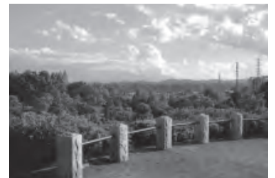
秋留台公園展望台からのながめ

今回はJR五日市線東秋留駅から秋川駅まで歩いてみましょう。東秋留駅改札を出て右に進み、線路を渡って、右に進んでいくとT字路に突き当たります。そこを左折すると左に階段があるので、上ると正面に 二宮神社 があります。同じ敷地内には市内の発掘調査で出土した土器や石器などが展示されている 二宮考古館 があります。二宮考古館を右手にまっすぐ進み、 五日市街道 に出たら左に曲がります。この道は左右にあきる野市の特産品でもあるとうもろこしの畑が広がっていることから、 とうもろこし街道 とも呼ばれ、ちょうど今から収穫期なので、農家の直売所で獲れたてのとうもろこしを買うことができます。しばらく進むと右手に 秋留台公園 があるので、園内へ進んでいきます。公園内には陸上競技場やバラ園、展望広場など、緑が豊富で日陰もたくさんあるので、休憩におすすめです。公園内を散策しながら展望台に向かいます。ここからは高尾山や大岳山、御岳山などの山々を見ることができます。西側の階段を下り、公園を出て左に進み、五日市街道に出たら右に進みます。 あきる野市役所 を過ぎると、左に 大塚古墳 のある 大塚公園 があります。古墳を見たら、五日市街道に戻ります。滝山街道を横断し少し進むと左がゴールの 秋川駅 です。