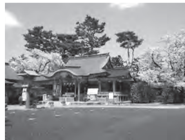
桜満開の東伏見稲荷神社