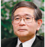
樋野 興夫先生 医学博士。順天堂大学医学部、病理・腫瘍学講座教授。著書は「がん哲学外来へようこそ」など多数。

多くのがん患者に寄り添ってきた樋野先生と、1人で悩まずお話ししてみませんか? がん相談窓口として「がん哲学外来」を毎月開催しています。まずはご連絡ください。