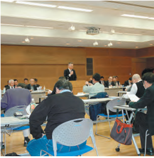
組合会のような様子