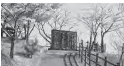
桜の木に囲まれ、見晴らしのいい高台にある日米首脳会談の碑