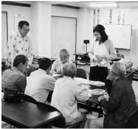
健康教室のようす (狛江支部)