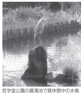
哲学堂公園の菖蒲池で昼休憩中の水鳥