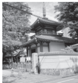
大通りの喧騒から切り離された新井薬師・梅照院

注意: 治療中の病気がある方は医師にご相談のうえ、行なってください。 過去の記事がホームページでご覧いただけます。